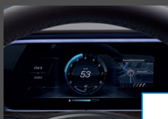
Widescreen cockpit (464) € 1.029