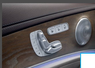
Memorypakket (275) € 1.234