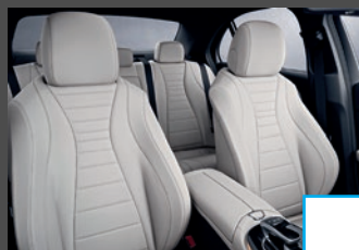
(Nappa)Lederen bekleding (2XX/8XX) (i.c.m. Business solution/AMG) € 2.093/2.662