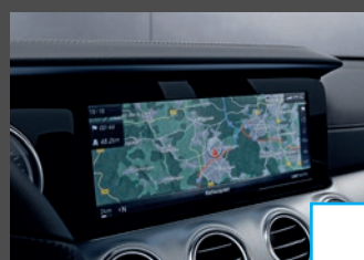
COMAND Online (531) € 1.271