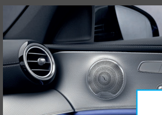
Burmester Surround Sound (810) € 1.029