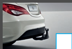
Trekhaak (550) € 956