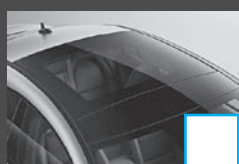
Panoramisch schuifdak 5) (413) € 1.137