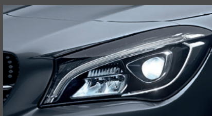
High-performance led-koplampen (632)